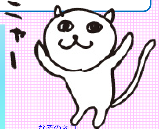
なそのネコ