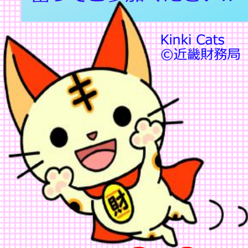
Kinki Cats