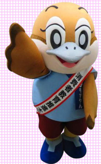
消費者教育推進大使 大阪府広報担当副知事もずやん