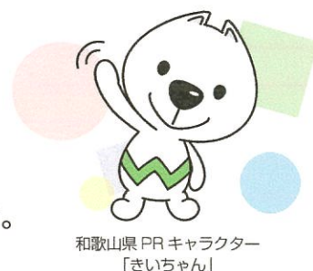
和歌山県PRキャラクター 「きいちゃん」