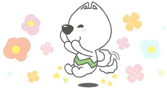
和歌山県PRキャラクター「きいちゃん」

会場の駐車場は台数が限られておりますので、なるべく公共交通機関の御利用をお願いします。