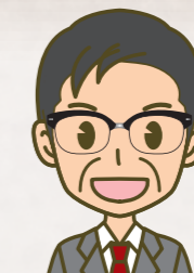
先生 ●学年主任 ●担当科目は現代社会