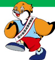
消費者教育推進大使 大阪府広報担当副知事 もずやん