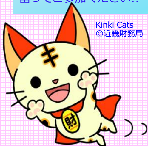
Kinki Cats ©近畿財務局