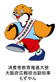
消費者教育推進大使 大阪府広報担当副知事 もずやん

大阪府消費者教育学生リーダー会は、消費者教育・啓発のリーダーとして活動できるような人材となるための基礎的な知識の習得を図る研修の受講者を中心に、府内の大学の学生等で構成する消費者教育・啓発活動を行うネットワークを構築し、大学生が消費者問題に関する啓発等をボランティア活動として実践するとともに、その活動が自発的かつ継続的に行われるための指導等を行う学生組織です。私たち学生リーダー会では、「一人ひとりの小さな消費行動が大きな社会問題の課題解決につながっていることを実感し、行動につなげていく」ことを柱に、社会や地球の未来について責任をもった消費行動を行うことができるよう、ちょっと立ち止まって考え、行動する人を増やしたいと考えています。企業×学生交流会は、学生が消費者教育に取り組んでいる企業について理解を深め交流する場であり、消費者教育に興味をもつ学生のネットワークを広げる場であることを目指しています。多くの企業や大学生の参加をお待ちしています！