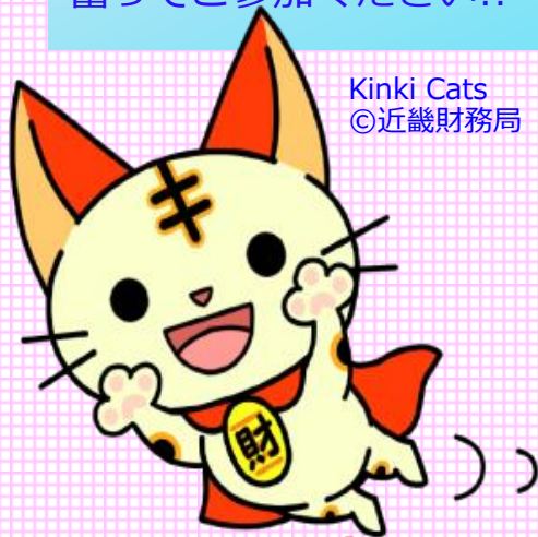
Kinki Cats