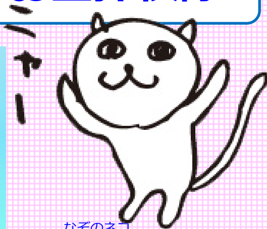
なそのネコ