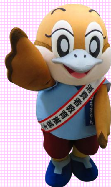
消費者教育推進大使 大阪府広報担当副知事もずやん