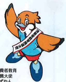
消費者教育 推薦大使 もずやん