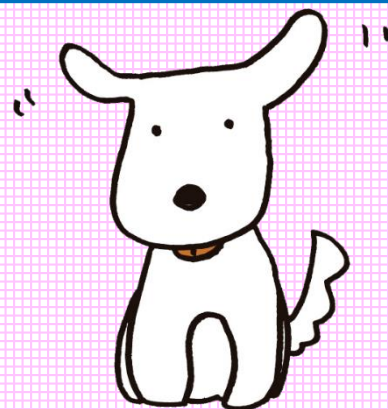
矢口 イチ ©大阪府金融広報委員会

子どもの考える力を養う参加型イベントです。 お金の大切さや賢い使い方について学ぶプログラム を親子で体験しませんか？ 毎年恒例となりました人気のイベントです。 奮ってご参加ください!!